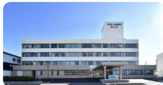
在宅療養総合支援センターかにえ