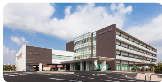
尾張温泉かにえ病院

患者さん・家族とともに 地域とともに 職員とともに 安心・安全な 信頼される医療・介護をめざします